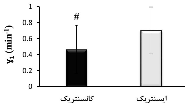
شکل ۳. مقادیر \gamma_1 (میانگین \pm انحراف معیار) در دوره بازگشت به حالت اولیه پس از فعالیت در دو پروتکل ECC/ECC و CON/CON

مقایسه آماری پارامتر تبادل لاکتات ( \gamma_1 ) در بین دو پروتکل نشان داد که \gamma_1 به طور معناداری در دوره بازگشت به حالت اولیه پس از پروتکل ECC/ECC بیشتر از CON/CON است ( t_0 = -3.47 و P < 0.01 ) (شکل ۳).