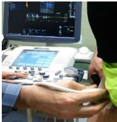
شکل ۱- نحوه اندازه‌گیری محدودیت جریان خون

در این پژوهش برای ایجاد محدودیت جریان خون از کش الاستیکی کاربردی پژوهشگر ساخته (به عرض هفت سانتی‌متر برای پایین‌تنه و عرض پنج سانتی‌متر برای بالاتنه) استفاده شد. برای تعیین میزان اعمال نیرو بر کش الاستیکی، آزمودنی‌ها با حجم ران متفاوت با دستگاه اولتراسونوگرافی (مدل GE-Logic E9; USA-2012) بررسی شدند؛ به طوری که قبل از شروع تمرینات، بعد از بستن کش‌های الاستیکی با دستگاه اولتراسوند، مقدار انسداد عروق هر آزمودنی و جریان خون شریانی با دستگاه توسط کش بررسی شد و با چند بار آزمون و خطا طول مناسب کش و میزان مناسب کشش با توجه به حجم ران به دست آمد. سپس، روی کش‌ها علامت‌گذاری شد و پس از آن تمرینات شروع شد. همچنین، به منظور اطمینان بیشتر برای ایجاد محدودیت جریان خون سرخرگی و مسدود شدن جریان خون وریدی (شکل شماره یک)، میزان فشار احساس شده توسط آزمودنی براساس مقیاس بورگ یک تا ۱۰ امتیازی از آزمودنی‌ها پرسیده شد و امتیاز هفت به عنوان معیار محدودیت جریان خون سرخرگی در نظر گرفته شد (۲۲، ۲۳). در حرکات خم کردن و بازکردن آرنج، بخش پروگزیمال بازو و در حرکات خم کردن و بازکردن زانو، بخش پروگزیمال ران توسط کش بسته شد. محدودیت اعمال شده در هنگام استراحت بین ست‌ها حفظ و بین حرکات برداشته شد (۲۴).