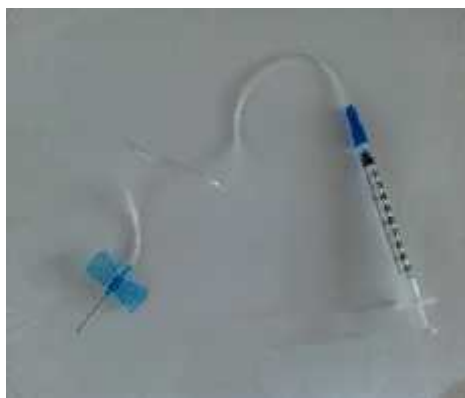
شکل ۱- سرنگ پروانه‌ای ۲۲G متصل به سرنگ انسولینی

یک) و به‌عنوان ابزار جمع‌آوری مایع مغزی نخاعی استفاده گردید. جهت جلوگیری از ورود خون به مایع مغزی نخاعی، نوک سرنگ به اندازه سه تا چهار میلی‌متر وارد سیسترنای مگنا گردید و عملیات کشیدن مایع توسط شخص دوم به آهستگی و در مدت کمتر از ۳۰ ثانیه تکمیل شد. همچنین، رنگ مایع به‌دقت کنترل می‌گردید تا آلوده به خون نباشد. سپس، مایع مغزی نخاعی جمع‌آوری شده (۴۰ تا ۹۰ لاند) در تیوپ‌های ۰/۲ تخلیه گشت و در دمای ۸۰- درجه سانتی‌گراد نگهداری شد (۱۶، ۱۵). بلافاصله پس از جمع‌آوری مایع مغزی نخاعی، نمونه خون به‌صورت مستقیم از قلب حیوان جمع‌آوری گردید، جداسازی سرم انجام گرفت و پلاسما با سانتریفیوژ در دمای چهار درجه سانتی‌گراد به مدت ۱۵ دقیقه و دور ۳۰۰۰g انجام گرفت. گروه تمرین + CGRP(8-37)، ۱۰ دقیقه قبل از انجام تمرین استقامتی، تزریق درون‌صفاقی (CGRP(8-37) به مقدار (10 µg/kg) را دریافت نمودند (۱۷). این تزریق به‌منظور منع گیرندهای CGRP و خنثی کردن عمل CGRP در بافت‌ها انجام شد. سپس، این گروه همانند گروه تمرینی محض، ادامه کار را تجربه نمود و مشمول جمع‌آوری مایع مغزی نخاعی، سرم و پلاسما پس از انجام تمرین شد.